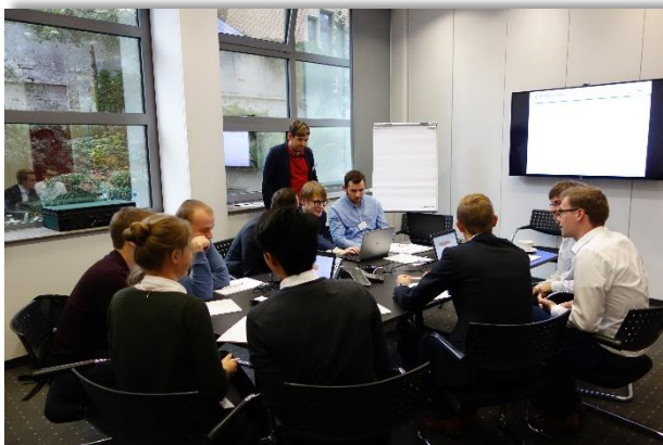
Teilnehmer des Mathematikertags bei der Gen Re testen in einem Workshop ihr mathematisches Fachwissen.

Die DGVMF richtet jedes Jahr etwa vier bis fünf Unternehmensbesuche aus. Falls Sie oder Ihr Unternehmen ebenfalls Interesse daran haben, interessierten Studierenden einen Einblick in den Arbeitsalltag in Ihrem Hause zu bieten, wenden Sie sich bitte an fee.koenig@aktuar.de .