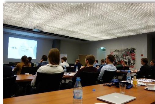
Der Mathematikertag bei der Gen Re in Köln bot den Studierenden ein abwechslungsreiches Programm.

Die Veranstaltungsreihe „Unternehmen stellen sich vor“ erfreute sich auch im Jahr 2018 wieder großer Beliebtheit. Insgesamt konnten vier Unternehmensbesuche an verschiedenen Standorten erfolgreich durchgeführt werden. Nach der R+V Versicherung in Wiesbaden und der SIGNAL IDUNA in Dortmund, die im Frühjahr und Sommer ihre Pforten für Studierende der Wirtschaftsmathematik und verwandter Studiengänge geöffnet hatten, folgten im September die Talanx Service AG in Hannover und im November die Gen Re in Köln. Neben verschiedenen Vorträgen zu versicherungs- und finanzmathematischen Themen konnten die Studierenden bei beiden Veranstaltungen in Kleingruppen ihr theoretisches Fachwissen in interaktiven Workshops an konkreten aktuariellen Fragestellungen erproben und so einen Einblick in den Berufsalltag in den mathematischen Fachabteilungen großer Versicherungen bekommen.