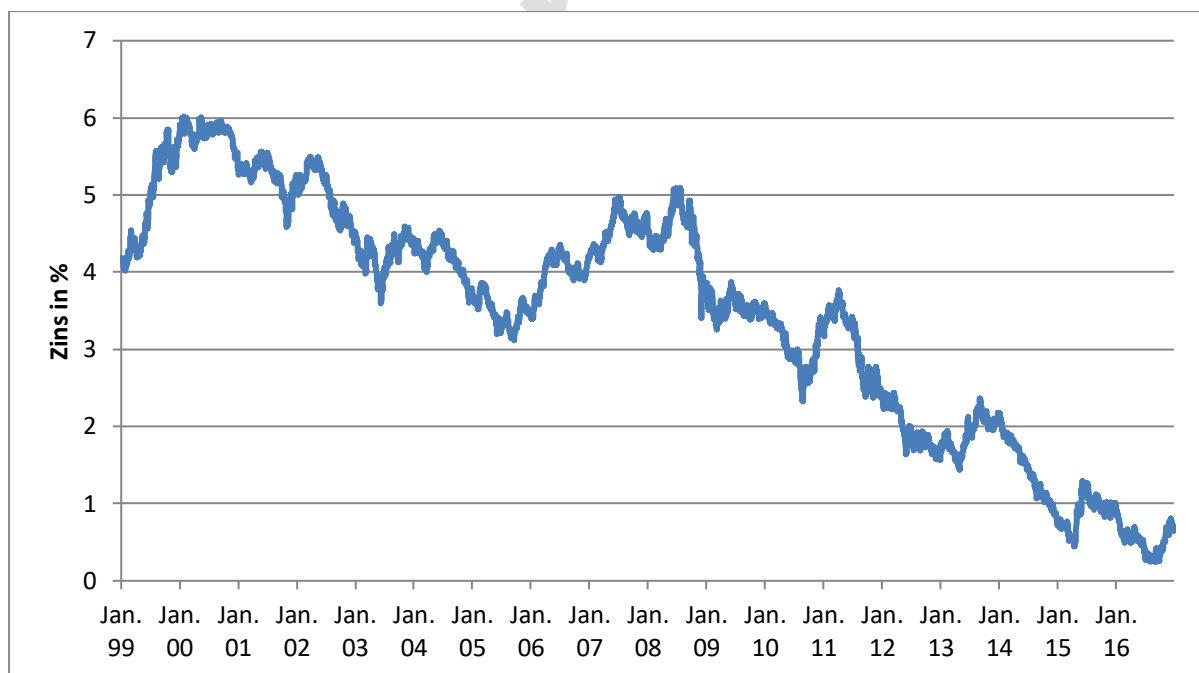
2) Abbildung 5.1: Zinsentwicklung für Swap-Geschäfte mit einer Restlaufzeit von zehn Jahren

In der nachfolgenden Grafik ist exemplarisch die Entwicklung einer Swap-Zinszeitreihe über die Zeit aufgeführt.